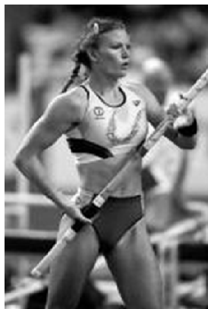
4. ábra. Yelena Isinbayeva és Emma George